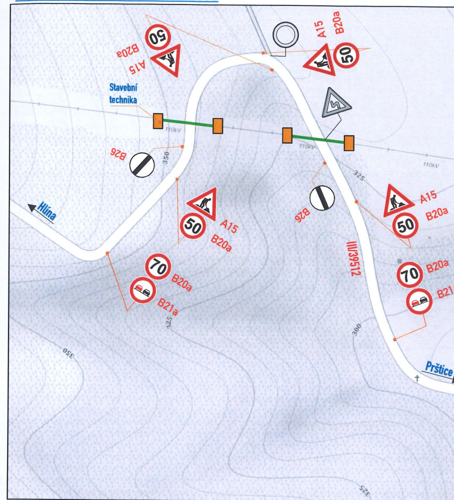
DETAIL 9: Termín: 15-17.10.2019 20. - 26. 9. 2019